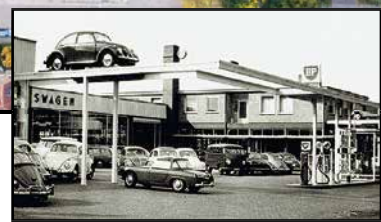
Garagebedrijf Sanato ± 1960

De woningen komen op het terrein waar lange tijd een autobedrijf was gevestigd dat enige jaren geleden naar de autoboulevard is gegaan. Het ontwerp van de woningen sluit goed aan bij de jaren dertig bouwstijl van de Dichterswijk, waarbij ook zeker gelet is op