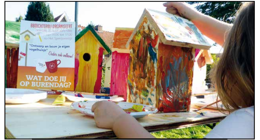
Burendag 2017 (1)

Actief met buurtbewoners en gemeente streven wij naar het behoud en verbetering van al het goede dat de wijk biedt.