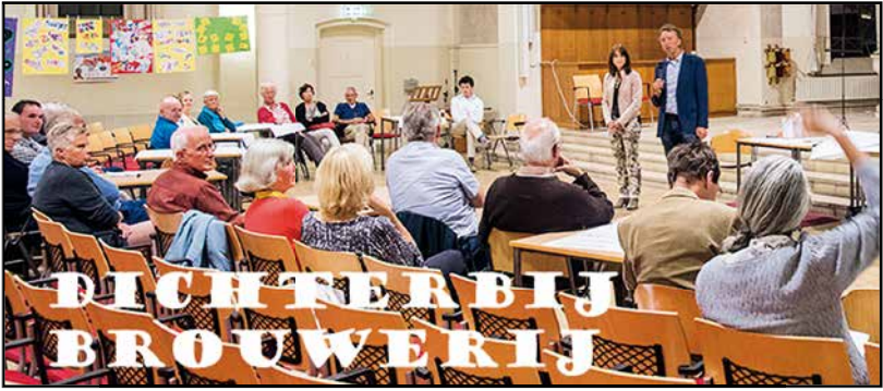
In gesprek met elkaar over de wijkvisie (1)

Het is goed wonen in onze wijk. Maar wat maakt de wijk tot wat het is? Wat vinden wij belangrijk in de wijk? Wat maakt het wijkgevoel? Hoe kunnen we het verbeteren? Wat moet blijven? Wat missen we?