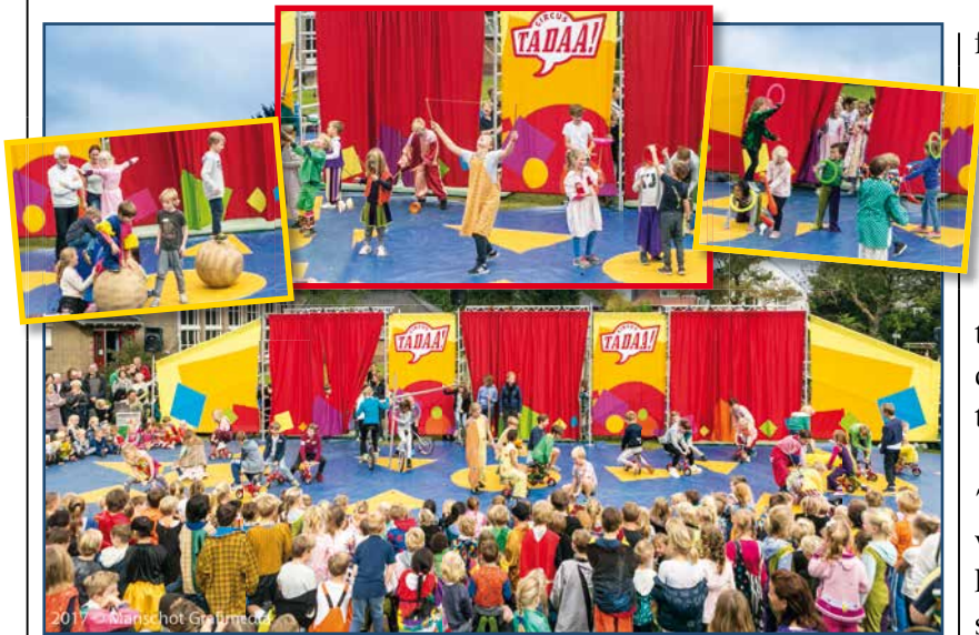
Circus Tadaa!

Met een fantastische feestweek heeft de basisschool CBS Ichthus haar 25-jarig bestaan gevierd. Een pyjamaontbijt,