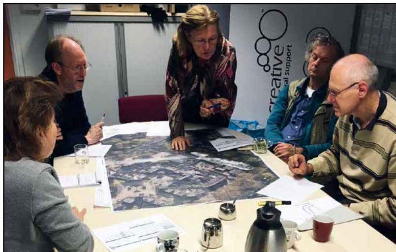
Overleg verbetering verkeersstromen.

De meeste van de jongeren verlaten onze school om te gaan werken: hetzij in een (beschutte) werkomgeving, hetzij in een dagbesteding of als vrijwilliger. Daarom is ons onderwijs sterk toekomstgericht: wat heb je nodig om straks op je eigen niveau goed je weg te vinden in de samenleving? Naast de cognitieve vakken werken we veel aan totale ontwikkeling: sociale competenties, praktische vaardigheden, stages en het vergroten van de zelfstandigheid. U zult ons bijvoorbeeld regelmatig met