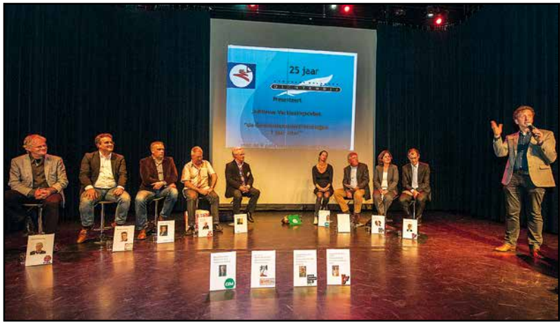
Politiek debat, 2016 (1)

Het is een traditie geworden dat BBDichterbij elk jaar een politiek debat organiseert. In 2014 is de huidige gemeenteraad gekozen. Vóór die ver-