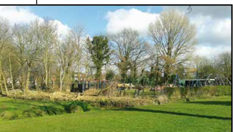
Speeltuin Burcht ter Kleeff