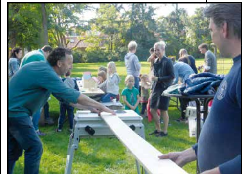
Burendag 2017 (1)