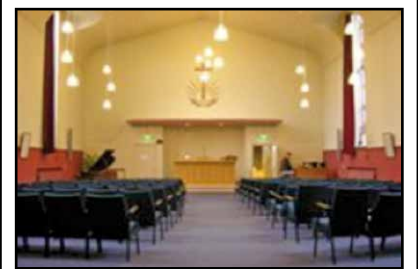
Interieur van de kerk, omstreeks 2005, met op de achtergrond het altaar

is het pand recentelijk verkocht. De nieuwe eigenaar wil er vijf woningen in maken. Om dit te realiseren moet er nog heel veel gebeuren. Want om van dit gebouw, dat óók een gemeentelijk monument is (nr. 0355/306), de functie 'bijeenkomst ruimte' te wijzigen in 'woonfunctie' zal er nog 'heel veel water over Gods akker vloeien'. Belangrijk is dat dit markante gebouw, omringd door groen, voor de wijk behouden blijft.