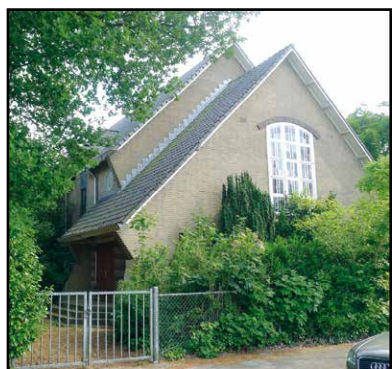
De kerk gezien vanuit de Bilderdijklaan. Het raam in de gevel verlicht de zaal boven de ingang waarvoorheen de zondagschool was

De gevels bestaan uit gele baksteen met bij de hoofdingang details in rode baksteen. Opvallend is dat dezelfde gele baksteen is gebruikt voor een blok huizen aan de overzijde