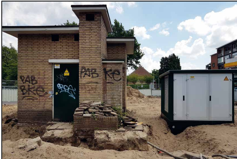
Oud en nieuw nog naast elkaar (juni 2017)

In het overleg met de omwonenden, de school en de gemeente is helaas duidelijk geworden dat het behouden van het groenpark niet haalbaar was. Het plantsoen bleek voor veel overlast te zorgen en werd als onveilig ervaren. BBD en andere wijkbewoners hadden graag gezien dat de grote hulstbomen behouden hadden kunnen worden. BBD betreurt het dat deze situatie zo drastisch onder handen moet worden