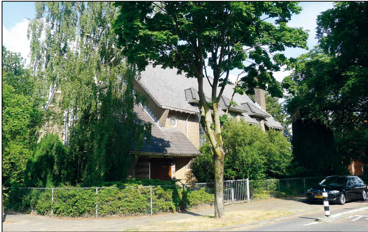
Nieuw-Apostolische kerk op de hoek van de Oude Arnhemseweg en de Bilderdijklaan

Aan de linkerkant bevindt zich een lager deel ook met een zadeldak. Hier is de hoofdingang gelegen, waarbij het dak ver doortrokken is tot