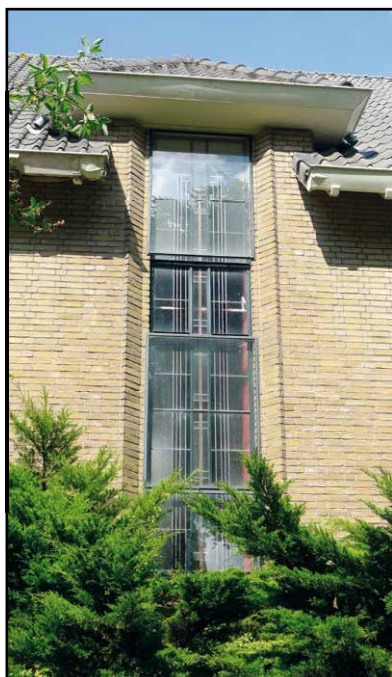
Eén van de kenmerkende hoge ramen met gekleurd glas-in-lood

vlak boven de ingang en als een luifel fungeert. Het lagere deel aan de rechterzijde bevat een secundaire ingang. Het gehele dak is gedekt met grijze dakpannen, dit in tegenstelling tot de huizen, die alle een rode dakbedekking hebben.