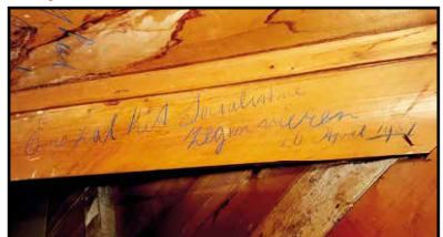
Eens zal het Socialisme zegenvieren, 26 april 1937

uitleg op een dwarsbalk: 'Vrijheid, Arbeid en Brood GH'. Een historische hartenkreet en tegelijk een boodschap van hoop. Kennelijk was de tekst door een van de werklieden opgeschreven. Het huis was onder leiding van de Zeister architect Gerrit Oskam gebouwd in een jaren-dertig-stijl die je ook in het Lyceumkwartier wel ziet. Veel glas-in-lood, lage schuine daken en specifieke ornamenten. Oskam was een man van de oude stempel. Als het hem niet zinde moesten de knechten het werk overdoen. Arbeiders hadden toen niet veel te vertellen. Het verhaal gaat dat zelfs geprobeerd is hem van een steiger af te gooien. De uitspraken op de balken laten zien dat de "sociale kwestie" toen erg speelde.